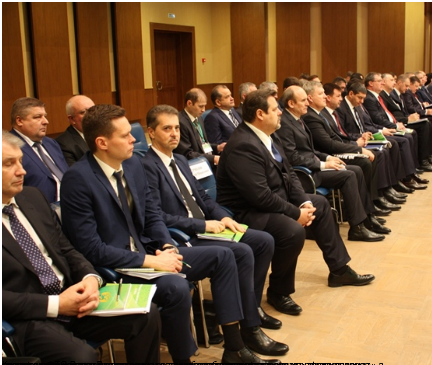
«Стратегия развития таможенной службы России на 2018-2024 годы» в